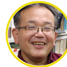
駒込 武 京都大学大学院 教育学科教授